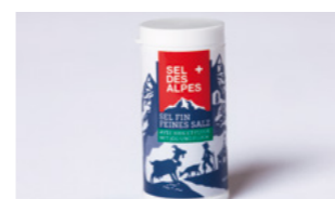
Salz Dösli auf Anfrage