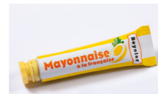
Mayonnaise Tube Art.-Nr. 62-9001-C-U-999