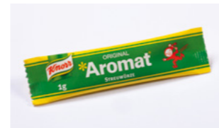
Aromat Streuwürze Beutel Art.-Nr. 62-9002-C-U-999