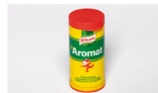
Aromat Streuwürze Dösli Art.-Nr. 62-9003-BOX-T-U